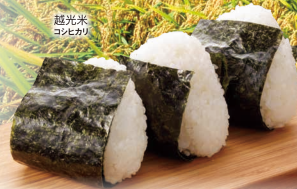
越光米 コシヒカリ