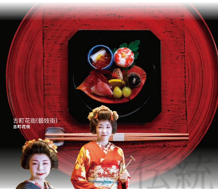
古町花街(藝妓街) 古町花街

豐富的積雪促使滑雪度假村的發達，滑雪場近處有溫泉。豊富な積雪量からスキーリゾートが発達。スキー場の近隣には温泉もあります。