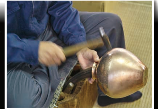
燕三條的金属加工業 燕三条の金属加工業