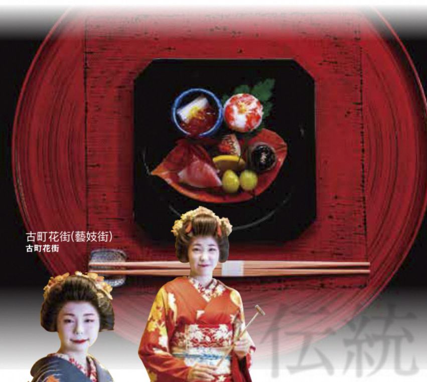
古町花街(藝妓街) 古町花街

國內屈指可數的滑雪場和溫泉 国内屈指のスキー場と温泉 豊富な積雪促使滑雪度假村的發達，滑雪場近處有溫泉。 豊富な積雪量からスキーリゾートが発達。スキー場の近隣には温泉もあります。