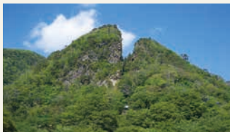
道遊の割戸 ©西山芳一 道遊の割戸 ©西山芳一

日本最大級の金銀山として16世紀末から国内外の経済に大きな影響を与えてきた「佐渡島の金山」。16世紀末～19世紀半ば、世界中が採鉱などの機械化が進んだ時代に、高度な手工業による採鉱と製錬技術を250年以上にわたり継続した、アジアにおける他に類を見ない貴重な文化遺産であると評価され、2024年7月に世界遺産に登録されました。