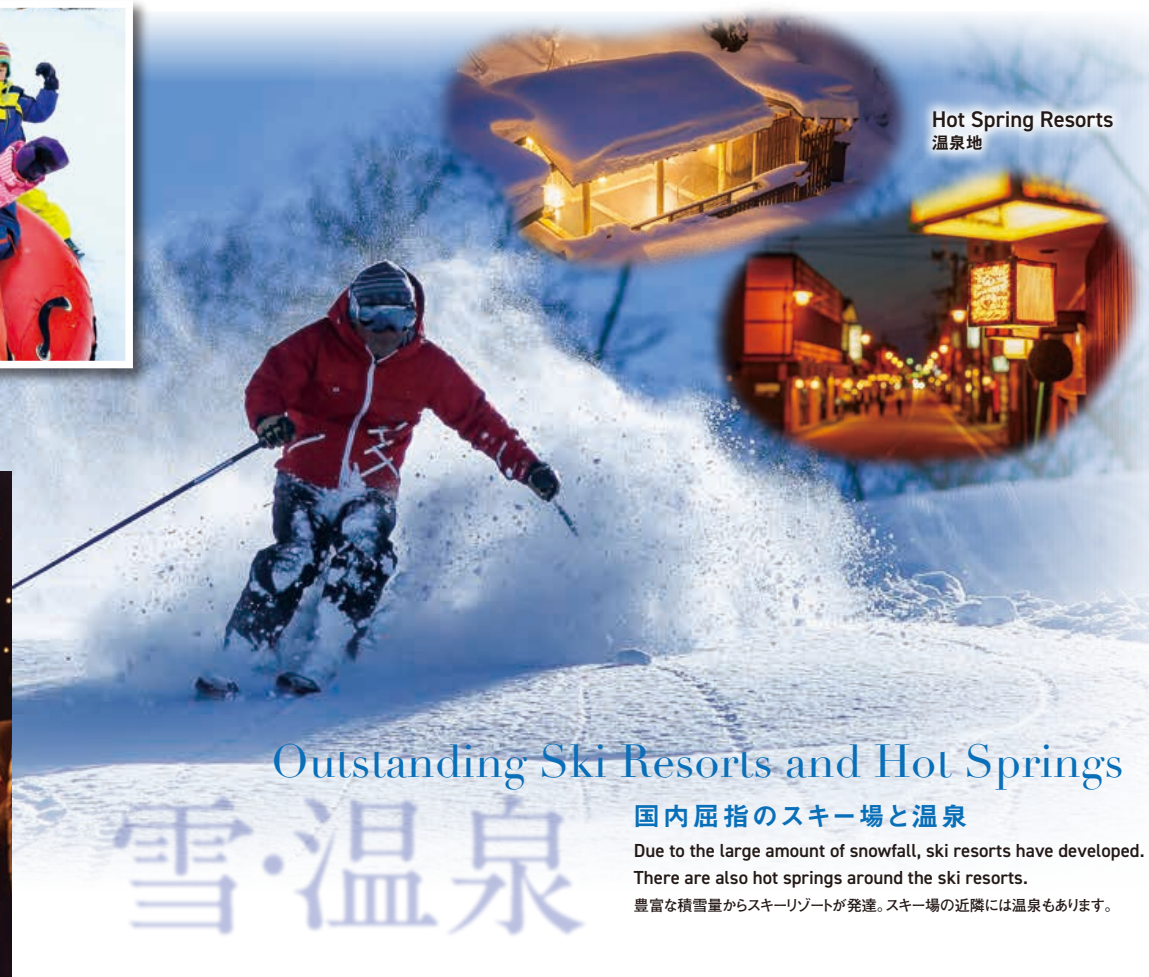
Hot Spring Resorts 温泉地