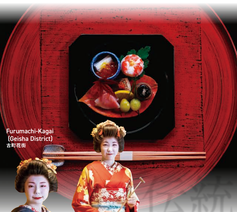
Furumachi-Kagai (Geisha District) 古町花街

Due to the large amount of snowfall, ski resorts have developed. There are also hot springs around the ski resorts. 豊富な積雪量からスキーリゾートが発達。スキー場の近隣には温泉もあります。