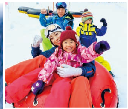
Ski Resorts スキー場