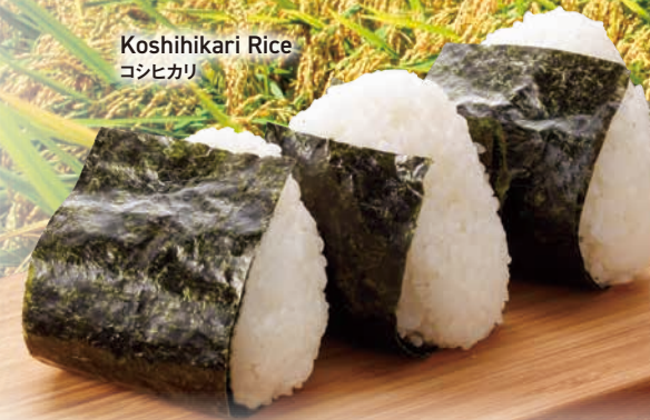
Koshihikari Rice コシヒカリ