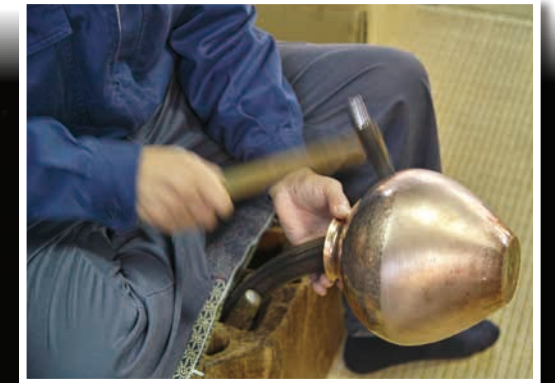
Metalworking in Tsubame-Sanjo 燕三条の金属加工業