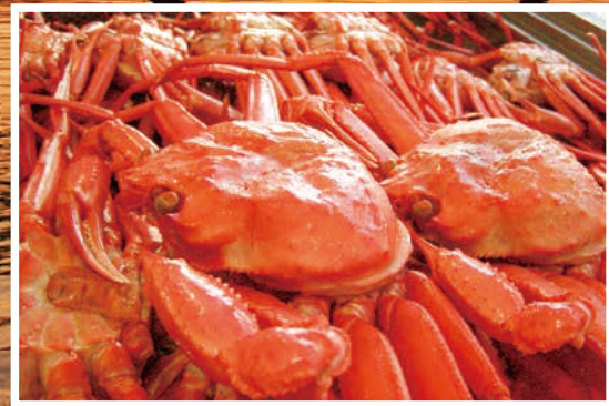
Red Snow Crab ベニズワイガニ