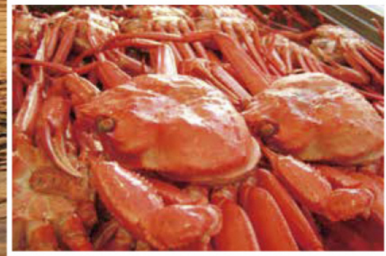
红雪蟹 ベニズワイガニ