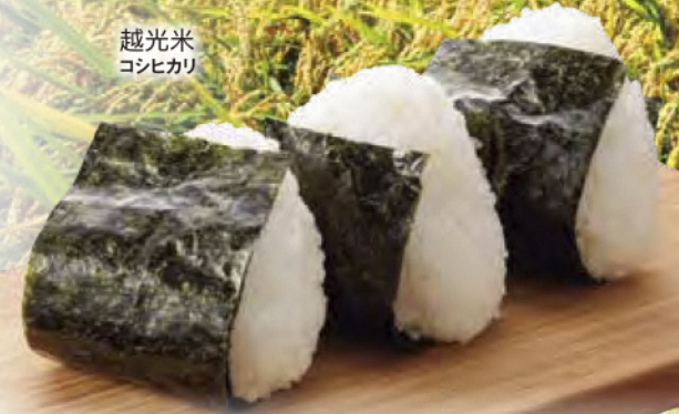
越光米 コシヒカリ