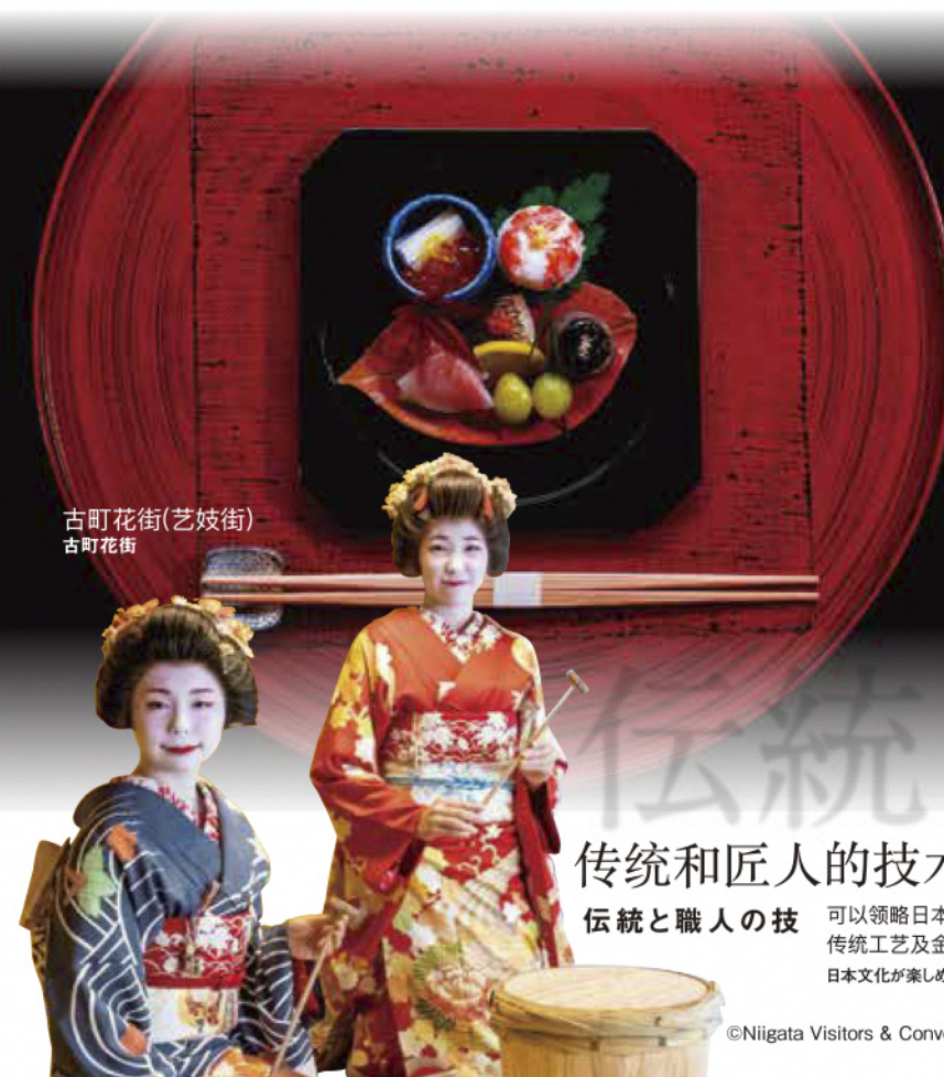
古町花街(艺妓街) 古町花街

国内屈指可数的的滑雪场和温泉 国内屈指のスキー場と温泉 丰富的积雪促使滑雪度假村的发达，滑雪场近处有温泉。 豊富な積雪量からスキーリゾートが発達。スキー場の近隣には温泉もあります。