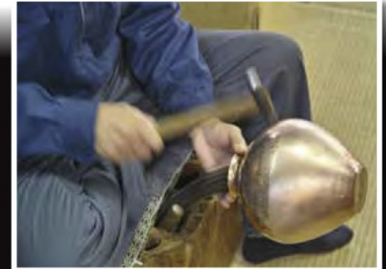
燕三条的金属加工业 燕三条の金属加工業